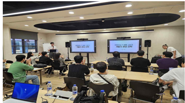
세미나 현장 사진