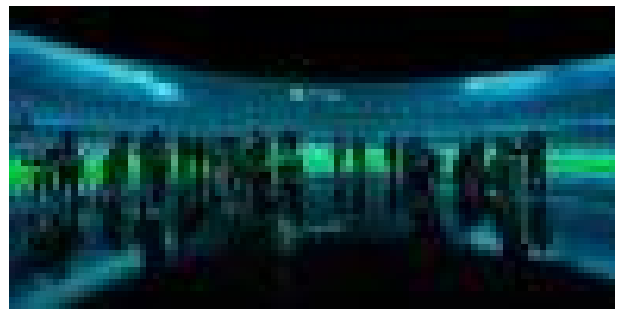
캠프 누 실내 ICT 체험장 사진