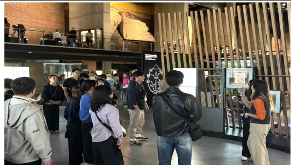
CosmoCaixa 과학 박물관