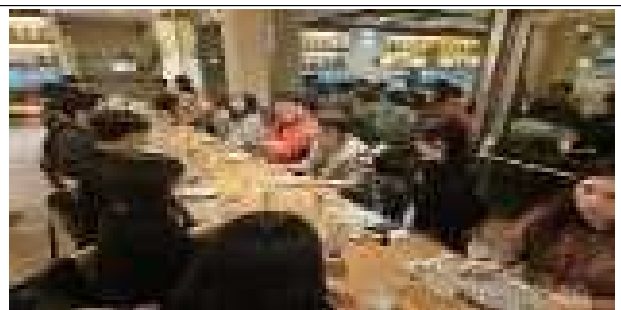
UPC 대학 방문