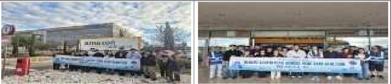
Amazon BCN1 현장 체험