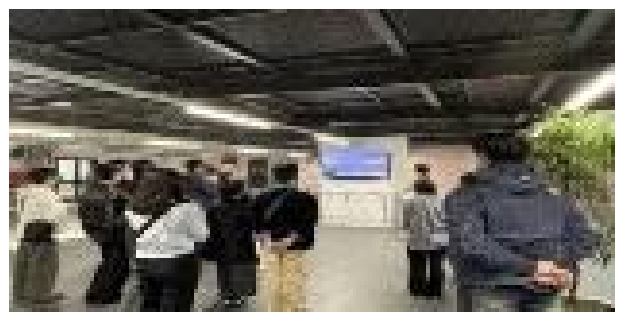
SEAT 마르토렐 자동차 공장 견학 사진